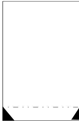
Klappe 10 x 8 cm

Falzen jede Seite bei 2 cm Schräg einschneiden